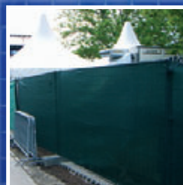
Austronet 348 Zaunblende Blinding

Patentierter Sicherheitszaun mit Reflexionsstreifen. Enorme Sicherheit bei Dunkelheit. Patented reflection fence. Extremely safety by darkness.