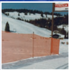
Austronet 350 Mobiler Leit- und Absperrzaun Mobile guide and barrier fence

Einfachst aufzustellen. Offenmaschiger hochreissfester Leit- und Absperrzaun inkl. Zaunstangen · Easy to install. Guide and barrier fence incl. fencepoles