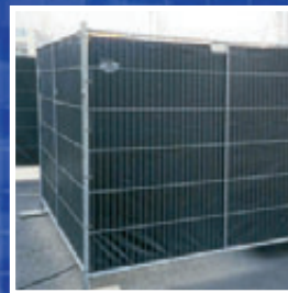
Austronet 450 PE Zaunelement

Blickdichte Absperrzaunelemente für Absperrgitter · Vision proof barrier fence element for barrier grids